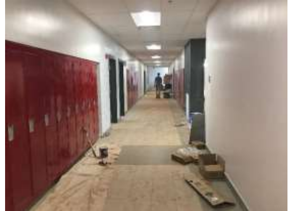
photo du corridor I